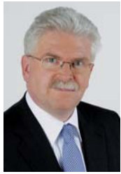
Martin Zeil Bayerischer Staatsminister für Wirtschaft, Infrastruktur, Verkehr und Technologie, München

Die Erhöhung der Energieeffizienz spart Energieressourcen, reduziert CO 2 -Emissionen und liefert einen wertvollen Beitrag zur Erreichung verbindlicher Klimaziele.