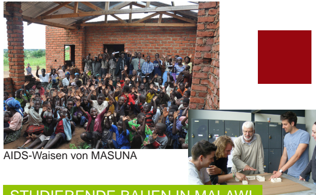
AIDS-Waisen von MASUNA

MASUNA hilft AIDS-Waisen, in guten gesundheitlichen und sozialen Verhältnissen aufzuwachsen. Ohne Eltern ist dies oft nicht möglich. Der MASUNA Campus dient als Anlaufstelle für AIDS-Kranke Jugendliche und Erwachsene.