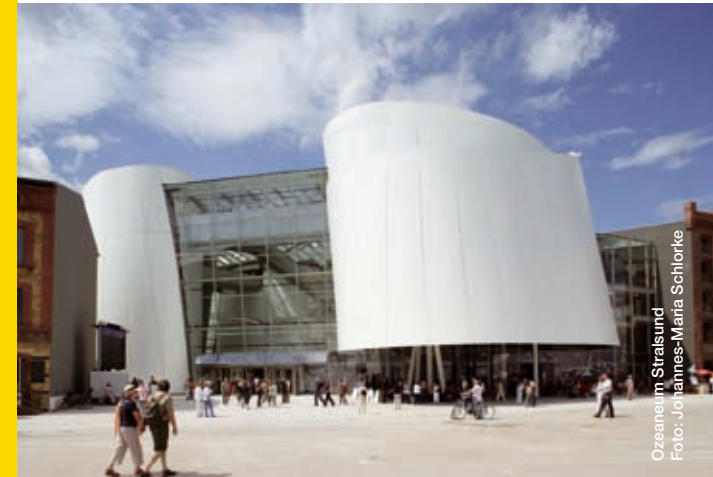
Ozeaneum Stralsund

Anmeldeschluss ist jeweils eine Woche vor der Veranstaltung.