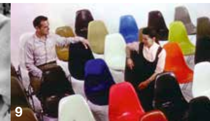
1+2: Eero Saarinen – The Architect who saw the Future 3+4: Peter Behrens – Vom Skizzenblock zum Alexanderplatz 5: Umbautes Licht – Manifeste der Industriearchitektur 6+7: Rams 8+9: Eames - The Architect and the Painter