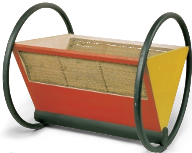
Peter Keler Kinderwiege, 1922 Klassik Stiftung Weimar