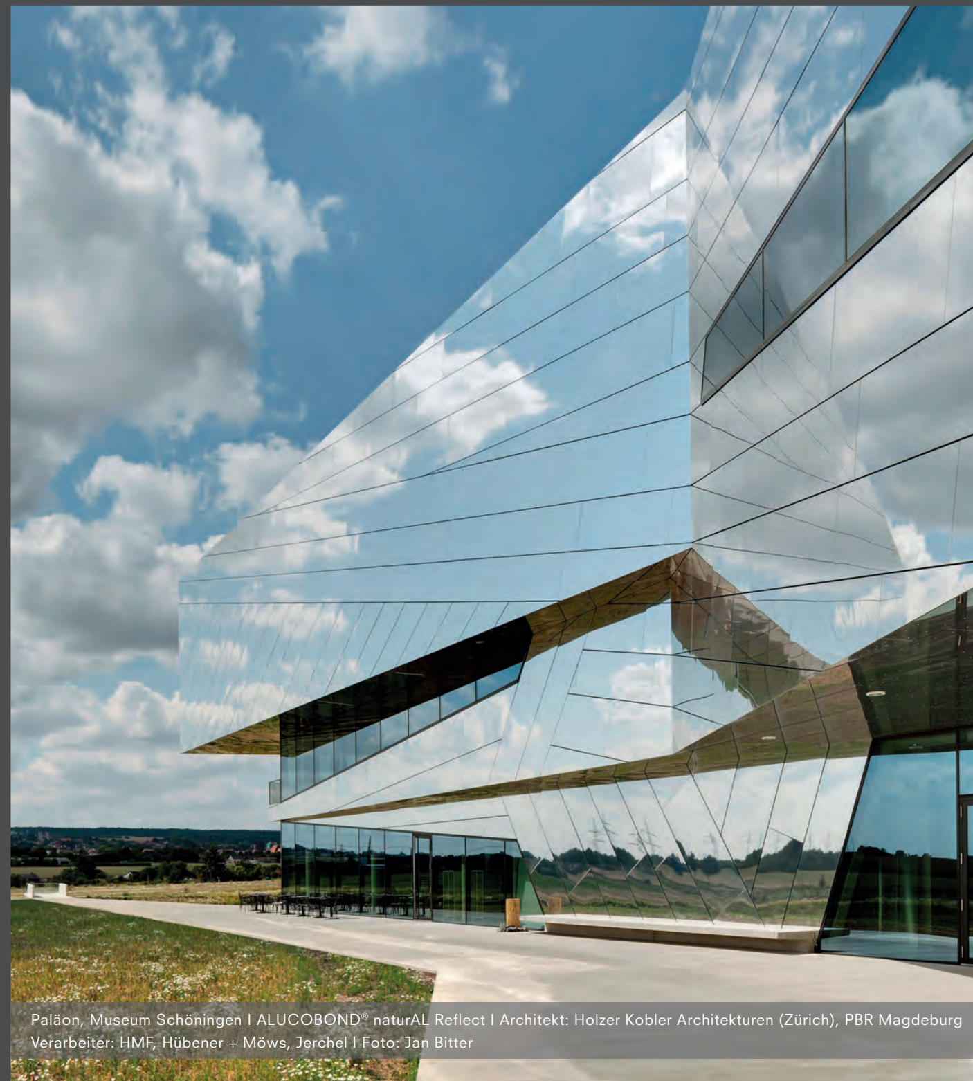
Paläon, Museum Schöningen | ALUCOBOND® naturAL Reflect | Architekt: Holzer Kobler Architekturen (Zürich), PBR Magdeburg Verarbeiter: HMF, Hübener + Möws, Jerchel